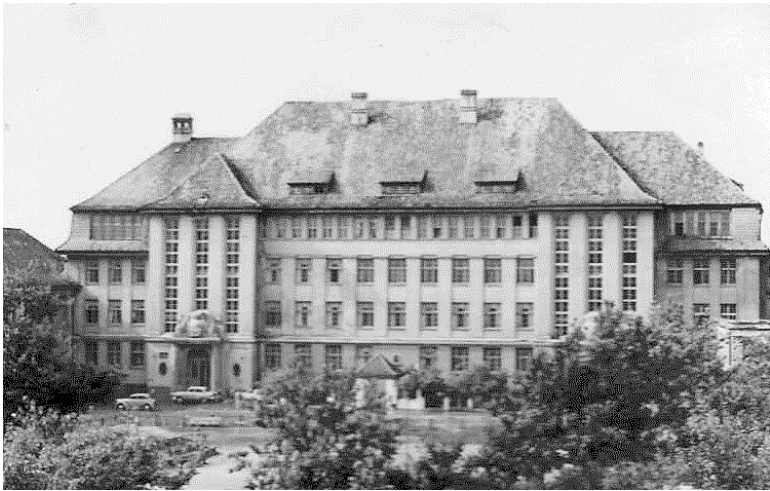
Корпус пединститута (университета) на ул. Чернышевского, 56а. 1967 г.

Подготовка историков с высшим образованием началась в Калининградской области в 1948 г. на дневном, а с 1949 г. и на заочном отделении открывшегося тогда государственного педагогического института. В нем был создан исторический факультет, объединенный в 1951 г. с филологическим факультетом.